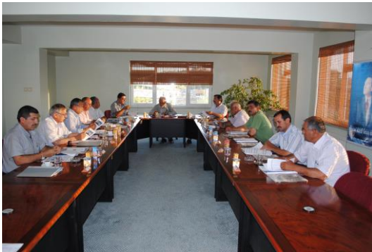
Meclis Toplantımızdan bir görüntü