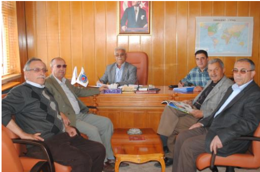
Yönetim Kurulu Toplantımızdan bir görüntü

Borsa yönetim kurulu, gerekli hallerde, yetkilerinden bir kısmını başkana, üyelerinden birine veya birkaçına yahut genel sekretere devredebilir.