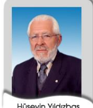
Hüseyin Yıldızbaş Meclis Başkanı